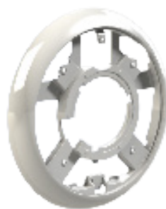
Stella Clip PF10R416